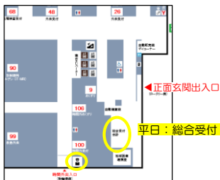
土日祝：防災センター